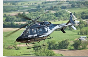
مروحية الخدمات الطبية الطارئة (HEMS)

كل مروحية من Bell Helicopter يساندها على مدار الساعة فريق دعم العملاء الحائز على جوائز عالمية. جاء ترتيب شبكة خدمات العالمية الشاملة لشركة Bell Helicopter في المركز ١ في هذه الصناعة. نحن نساند كل طاقم طائرة في كل قارة وفي كل منطقة بالخبرة والأجزاء والخدمات المطلوبة لاستيفاء متطلبات المهمة.