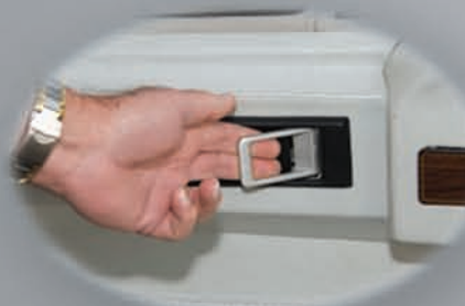
Abra la puerta