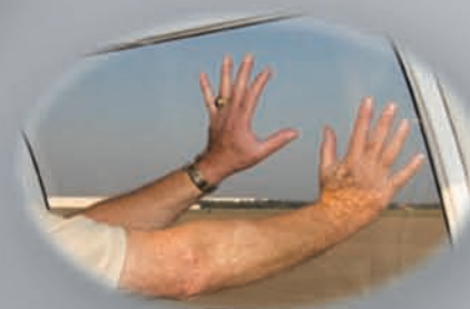
Salida de emergencia cabina/pasajero