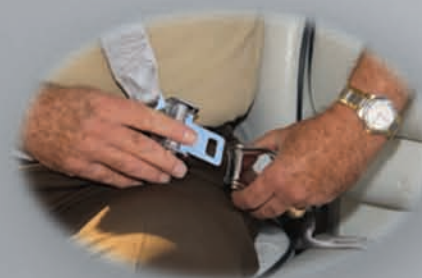
Abroche el cinturón